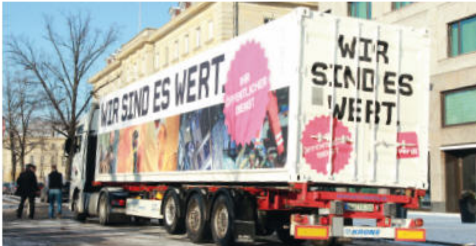
Wir sind es wert! Die Kampagne für die Tarifrunde 2012.