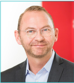
Frank Werneke ver.di-Vorsitzender

„Massenhaft unbesetzte Stellen, Arbeiten bis zum Anschlag – jetzt ist die Zeit, zielgerichtet zu verhandeln. Wir erwarten ein Angebot – spätestens in der zweiten Runde!“